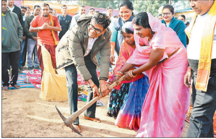
भूमि पूजन के बाद सांकेतिक निर्माण के लिए खुदाई करते वित्त मंत्री व अन्य जनप्रतिनिधि।