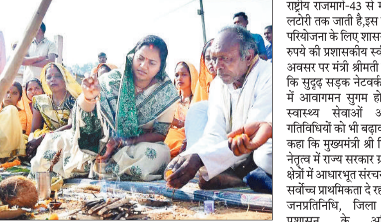
इसके पश्चात उन्होंने ग्राम महेशपुर में 5.80 मजबूतीकरण कार्य की शुरुआत पूजा-अर्चना के साथ की, यह सड़क सिलफोली किलोमीटर सड़क के चौड़ीकरण एवं