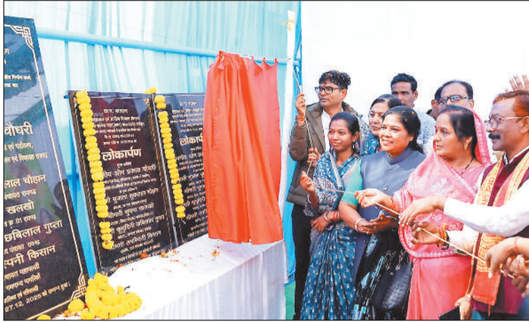
भूमि पूजन के बाद सांकेतिक निर्माण के लिए खुदाई करते वित्त मंत्री व अन्य जनप्रतिनिधि।

और जनहितकारी नेतृत्व में छत्तीसगढ़ सरकार गांव, गरीब, किसान और महिलाओं के सशक्तिकरण को सर्वोच्च प्राथमिकता देते हुए निरंतर विकास की नई इबारत लिख रही है। उन्होंने प्रदेश सरकार की ऐतिहासिक उपलब्धियों और जनकल्याणकारी योजनाओं का विस्तार से उल्लेख किया। उन्होंने कहा कि किसानों को लंबित धान बोनस का भुगतान, धान खरीदी की सीमा और समर्थन मूल्य में बढ़ोतरी, महिलाओं के लिए महतारी वंदन योजना की