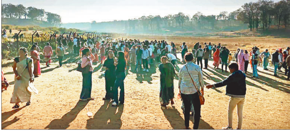
दलदली में पर्यटकों की भीड़।