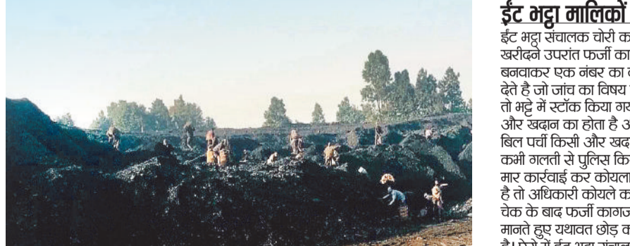
कोयला चोरी करते ग्रामीण।

टंड बढ़ते ही एक बार फिर गायत्री खदान कोयला चोर गिरोह सक्रिय हो गए हैं जो रोजाना बड़ी मात्रा में कोयला चोरी कर आसपास क्षेत्र के गमला व ईंट भट्टे में चोरी का कोयला खपा रहे हैं। जिस तरह से गायत्री खदान से हर रोज तीन हजार टन से ऊपर कोयला उत्पादन कर रही है ठीक उसी प्रकार कोल माफिया सक्रिय होकर बड़ी मात्रा में कोयला चोरी कराकर अवैध रूप से कमाई कर रहे हैं, जो प्रबंधन की उदासीन सुरक्षा व्यवस्था को प्रदर्शित करता है।